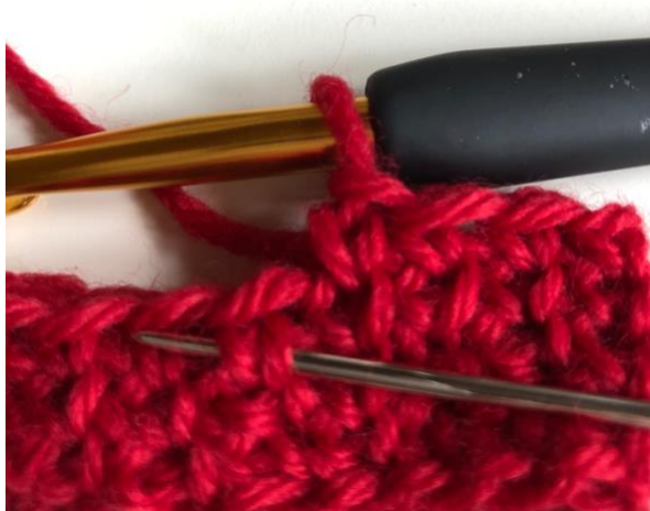
Stoppnålen visar v:et. Virknålen ska ner mitt i v.

Det krävs en hel del träning innan man får in rätt teknik, så träna gärna med restgarner och förbered dig på att det krävs både envishet och tålamod för att få in rätta snitsen med virknålen. Det finns också många bra videotutorials på nätet.