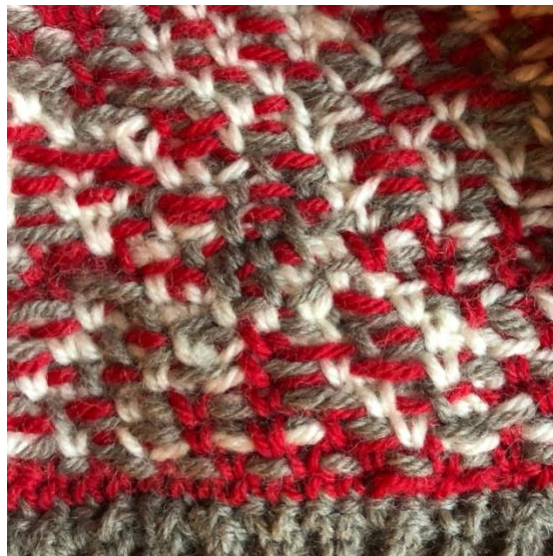
Insidan av mössan.